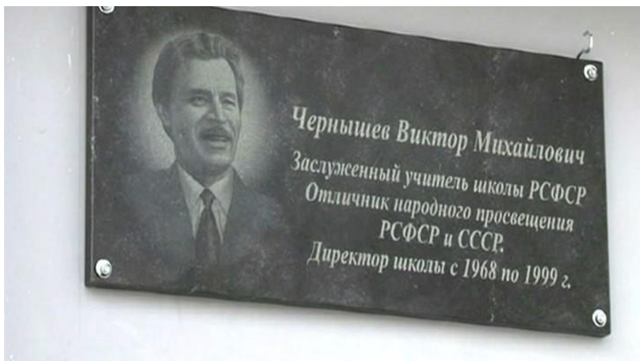
Мемориальная доска В.М. Чернышева 20 февраля

Матвеева, Е. Пельмени в лесу / Е. Матвеева. – Текст непосредственный // Златоустовский рабочий. – 1968. – 17 февраля. – № 36. – С. 3.