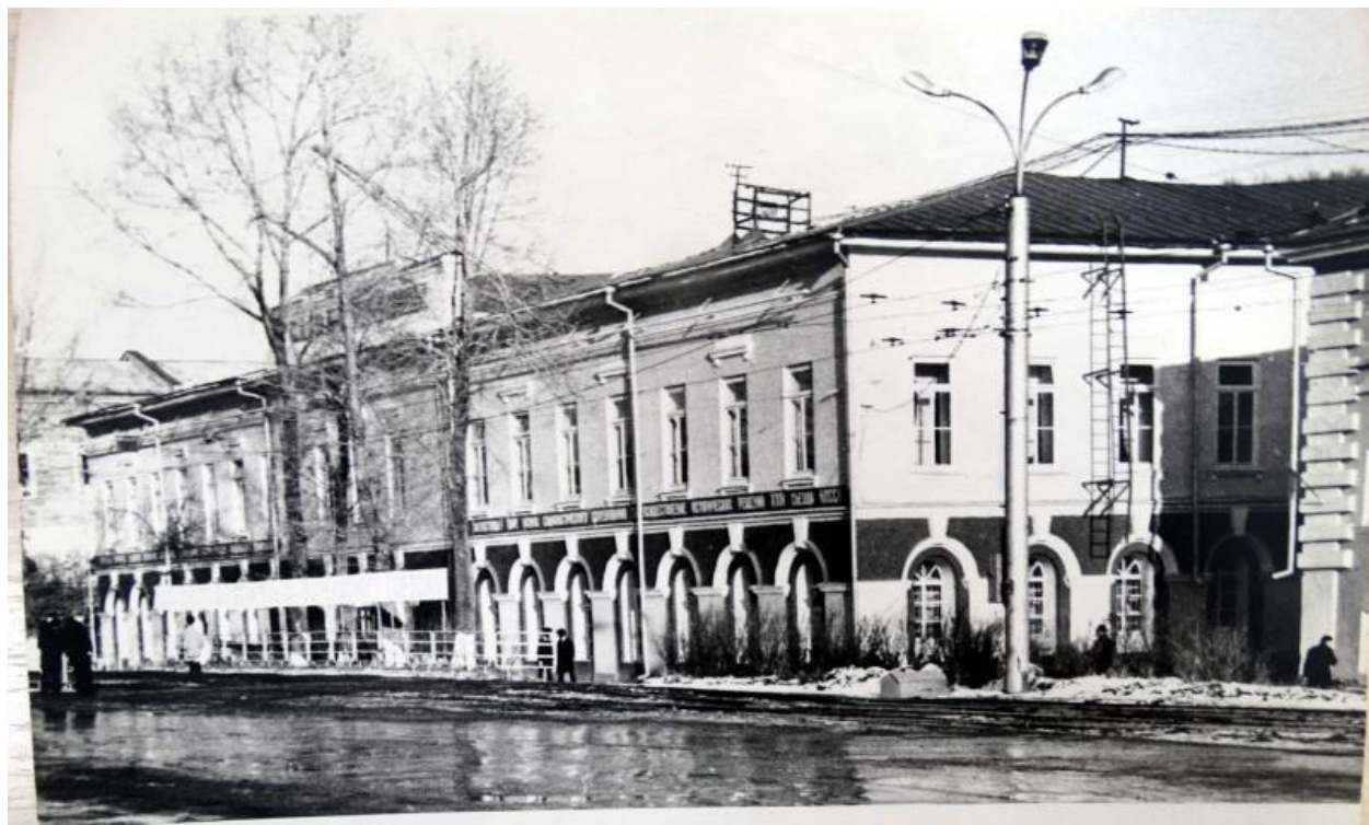
Завод им. В.И. Ленина

Дружат два коллектива. – Текст непосредственный // Златоустовский рабочий. – 1968. – 8 февраля. – № 29. – С. 1.