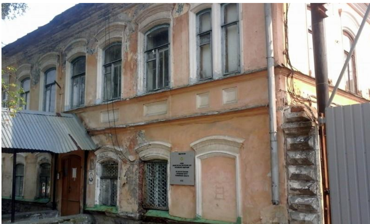
Здание педагогического училища на ул. Ленина 15 февраля

Кувайцева, В. Два дня волнений / В. Кувайцева. – Текст непосредственный // Златоустовский рабочий. – 1968. – 14 февраля. – № 33. – С. 4.